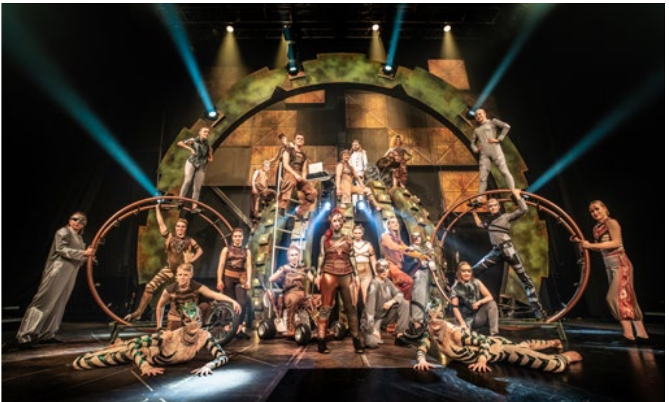
Kuva: Kristian Wanvik

Soriferian ensi-ilta oli 22.11.2019. Tirehtööri Taina Kopran käsikirjoittama ja ohjaama Joulushow sai jälleen erinomaisen vastaanoton sekä yleisöltä että kritikoilta. Esiintyjä lavalla nähtiin 22. Juho Fabrinin ja Joonas Kukkolan säveltämä musiikki tuki hienosti tarinaa. Tanssikoreografioista vastasi Marjo Terästä. Vahvasta visuaalisesta ilmeestä vastasivat Eero Auvinen (valosuunnittelu), Kitta Klemetilä (pukusuunnittelu) ja Oskari Löytönen (lavastussuunnittelu), Malla Tallgren (kampanusten suunnittelu) ja Jonna Kivimäki (maskeeraussuunnittelu). Sirkusteknisestä toteutuksesta vastasi maneesimestari Jouni Kivimäki.